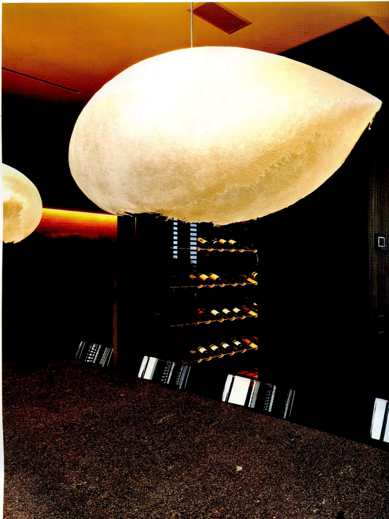
Lampadario realizzato da Catellani & Smith su disegno di Giuseppe Tortato, mod. sweet light e Postkrisi.