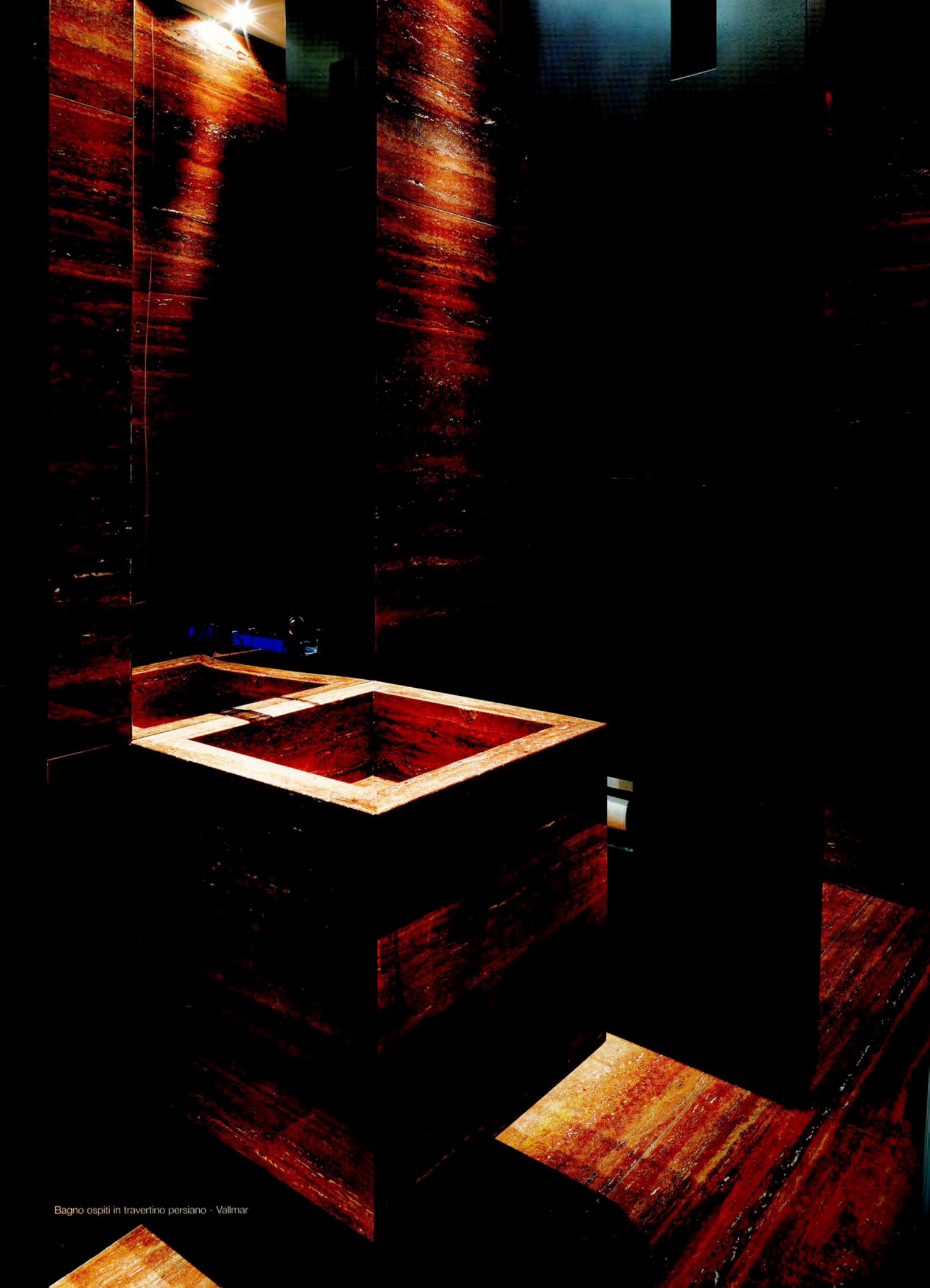
Bagno ospiti in travertino persiano - Vallmar