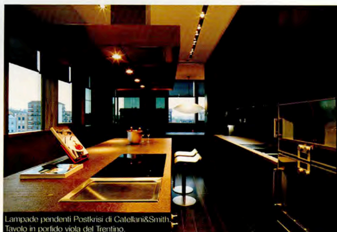
Lampade pendenti Postkrisi di Cattellani&Smith. Tavolo in porfido viola del Trentino.

dal piano lavoro che può essere nascosto all'occorrenza da grandi ante in legno apribili totalmente a scomparsa. I colori della cucina vengono ripresi dal tavolo della zona pranzo che conclude il percorso della zona giorno e che si affaccia sul soppalco in vetro, a sbalzo sul soggiorno.