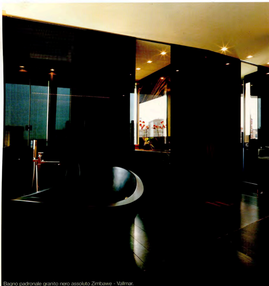
Bagno padronale granito nero assoluto Zimbabwe - Vallmar.