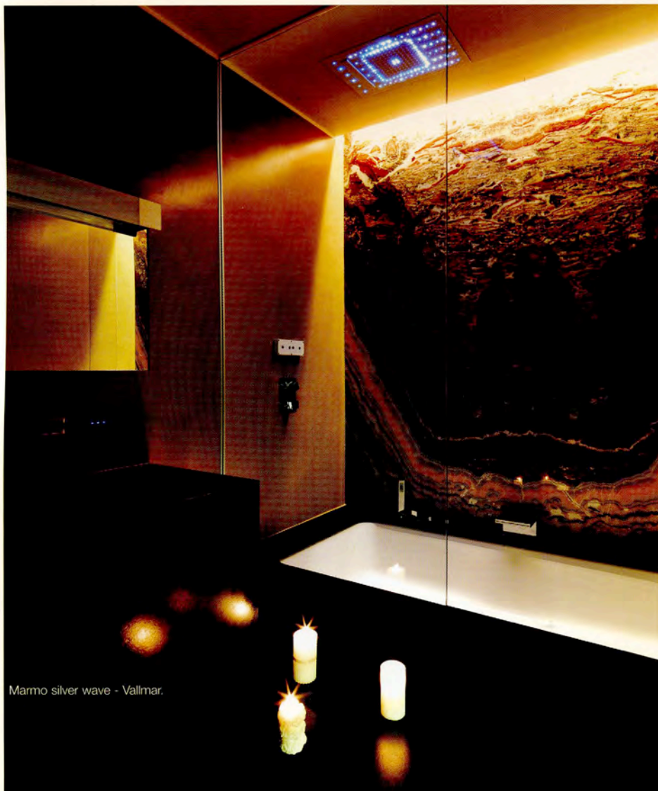
Marmo silver wave - Vallmar.